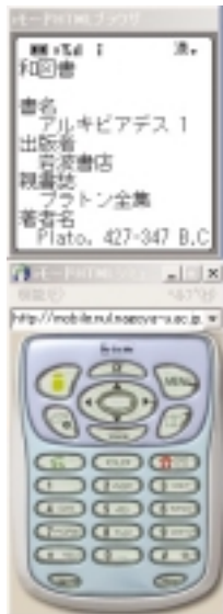
モバイルOPACでの検索