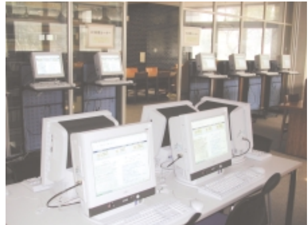
利用者用端末が設置されたPC利用コーナー