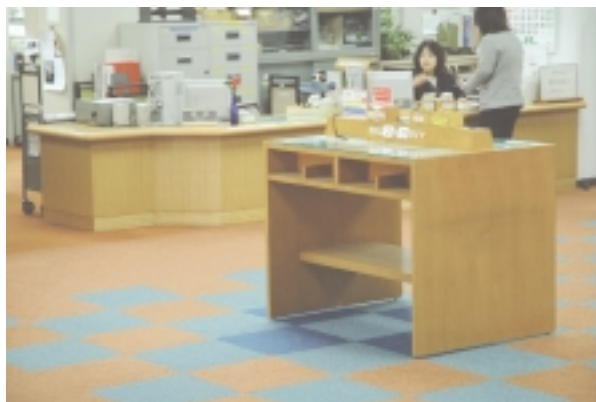
明るくなった2階ホール

交換なども行いました。安全で快適な学習空間の提供は、図書館の重要な役割の一つと位置付け、職員の館内巡視なども行っていますが、館内での飲食や試験期の席取り、無防備な貴重品放置など、より重大な被害につながる事例も多く、利用者の皆さん個々のご協力もよろしくをお願いします。